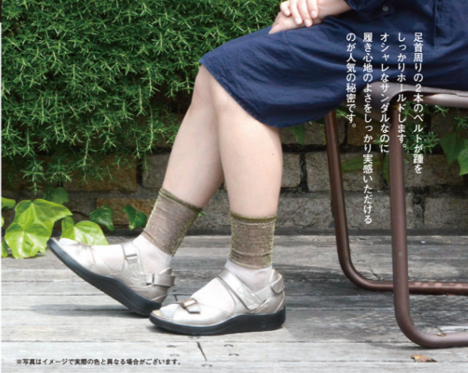
※写真はイメージで実際の色と異なる場合がございます。

足首周りの2本のベルトが踵をしっかりとホールドします。オシャレなサンダルなのに履き心地のよさをしっかりと実感いただけるのが人気の秘密です。