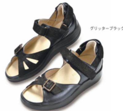
グリッターブラック