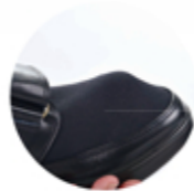
裏素材の変更により伸縮性がUPしました。

見た目はローファーデザインでもベルトストラップで着脱できる、快適なコンフォートシューズです。通学履きにもご愛用いただいています。