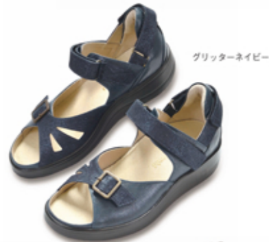
グリッターネイビー