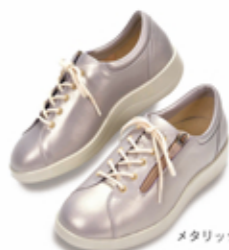
メタリックグレー